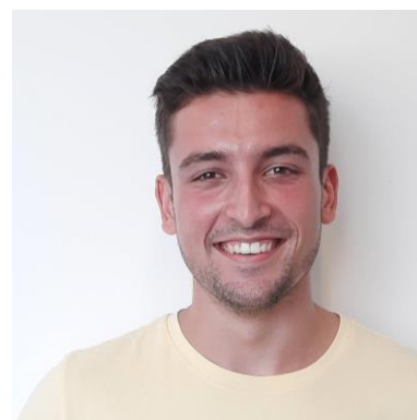
Meester Daan 2C